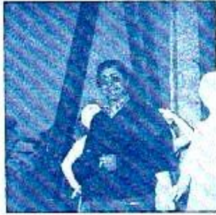
Nuestro Delegado de Festejos SATISFECHO

Nuestras fallas y la iluminación de las calles... una realización de esta comisión